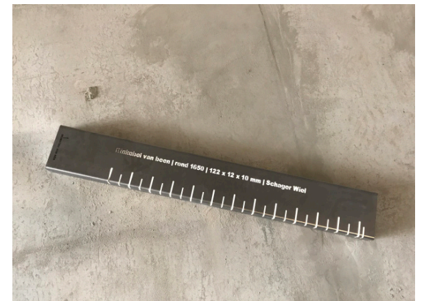
Monster van Nes / 2017