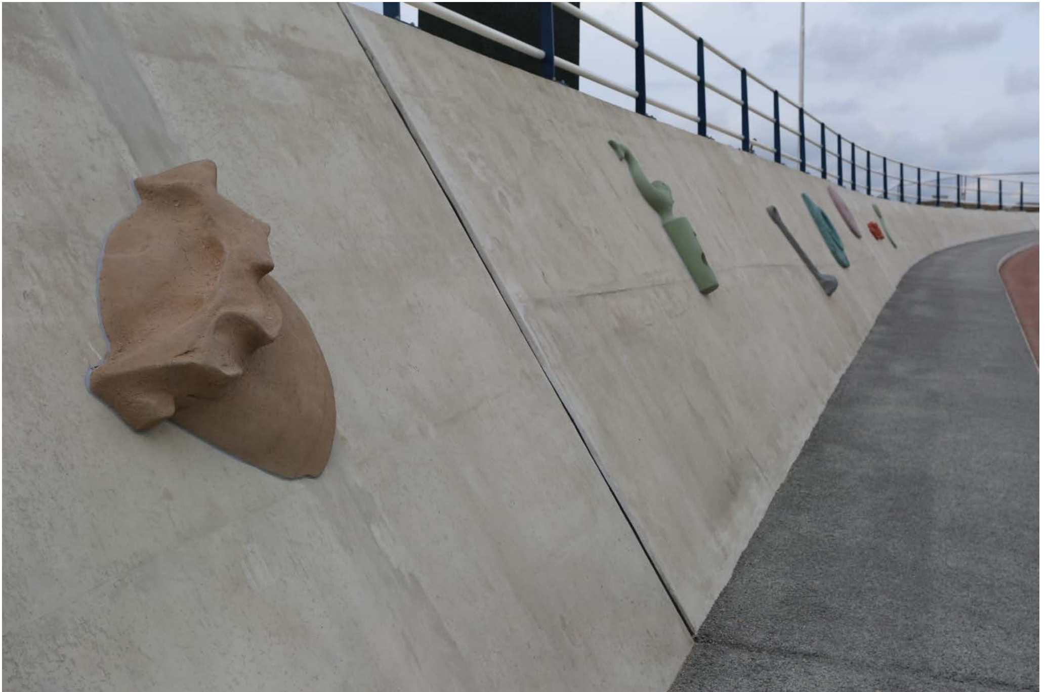
Monster van Nes / 2017