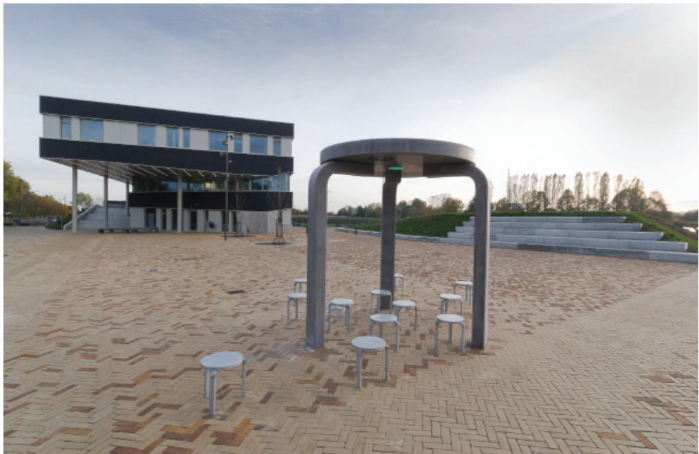
Wereldplek / 2011